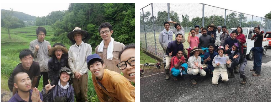
田植え、草刈り、稲刈り・・・作業後は決まって集合写真を撮るのが棚田団流。