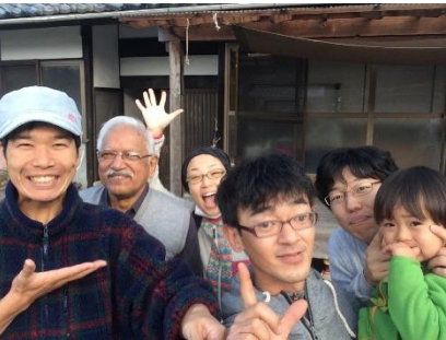
梅谷家の前にて 記念撮影

学でも講師をされていたそうです。上山を案内させていただく際に、興味深く各所を見て回られていたのにも納得です。「上山はこれまでの成果をもっと見えやすいようにすれば、活動を応援してくれる人が増えるよ」というアドバイスもいただきました。夕食には鍋をつつきながら、上山で獲れた鹿肉なども食べていただきました。「昼の最初に布団を敷いて寝るのは初めてだ」ということで、日本家屋での一夜を楽しくいただきました。