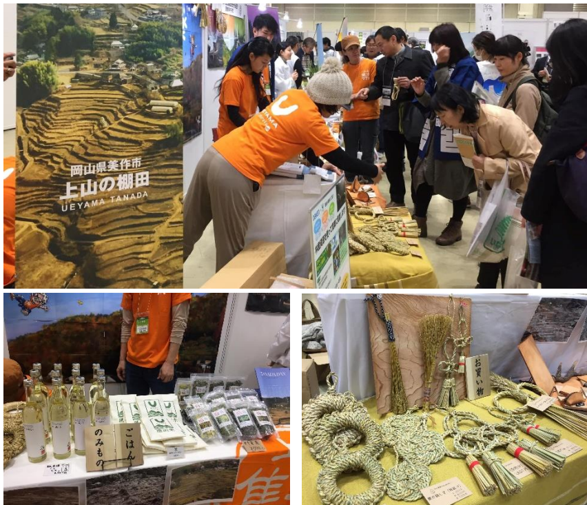
農閑期の間に各地で上山をPR

毎年12月、東京で開催される「エコプロダクツ展」に英田上山棚田団も出展しています。エコプロダクツ展は環境への関心の高い一般消費者やビジネスパーソン、行政・自治体、NPO、環境教育を目的とした学生、報道関係者など、環境を取り巻く多様なステークホルダーが一堂に集う展示会。全国の棚田地域が10団体以上集まって共同で一区画を確保し、ブースを出して